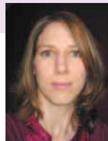
Par Aline Chenu, ergothérapeute au CHI de Poissy Saint Germain-en-Laye

Des rénovations dans la salle de bain doivent conserver votre autonomie le plus longtemps possible. Les aménagements doivent être adaptables selon les troubles d'équilibre et de coordination et le niveau de fatigabilité.