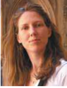
Par Aline Chenu, ergothérapeute au CHI de Poissy Saint Germain-en-Laye